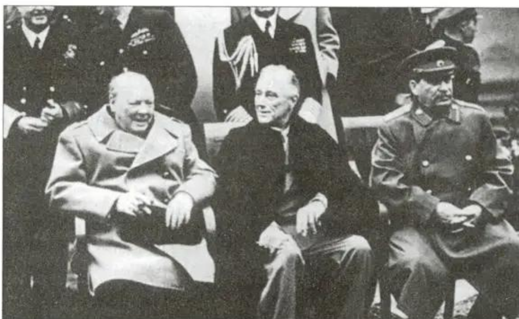
Hình 22. (từ trái sang phải) Sốc-sin, Ru-dơ-ven và Xta-lin tại Hội nghị I-an-ta

Vào giai đoạn cuối của Chiến tranh thế giới thứ hai, ba nguyên thủ các cường quốc Liên Xô, Mĩ và Anh là Xta-lin, Ru-dơ-ven và Sốc-sin đã có cuộc gặp gỡ tại I-an-ta (Liên Xô) từ ngày 4 đến ngày 11 - 2 - 1945.