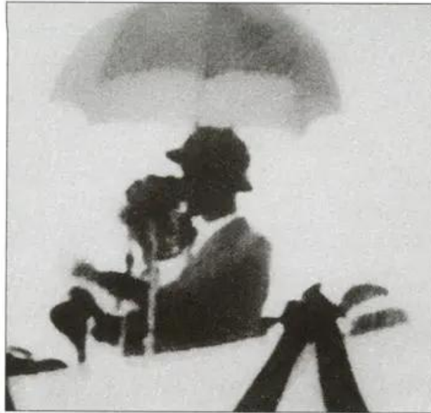
Hình 40. Chủ tịch Hồ Chí Minh đọc Tuyên ngôn Độc lập (2 - 9 - 1945)

Ngay từ những ngày đầu tháng 8, một không khí gấp rút chuẩn bị khởi nghĩa đã sục sôi trong cả nước. Từ ngày 14 - 8 đến ngày 18 - 8, ở nhiều xã, huyện thuộc một số tỉnh đã nối tiếp nhau chớp thời cơ nổi dậy giành chính quyền. Bốn tỉnh giành được chính quyền ở tỉnh lỵ sớm nhất trong cả nước là Bắc Giang, Hải Dương, Hà Tĩnh và Quảng Nam.