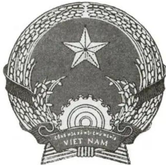
Hình 80. Quốc huy của nước Cộng hoà xã hội chủ nghĩa Việt Nam

Quốc hội bầu các cơ quan, chức vụ lãnh đạo cao nhất của nước Cộng hoà xã hội chủ nghĩa Việt Nam, bầu Ban dự thảo Hiến pháp.