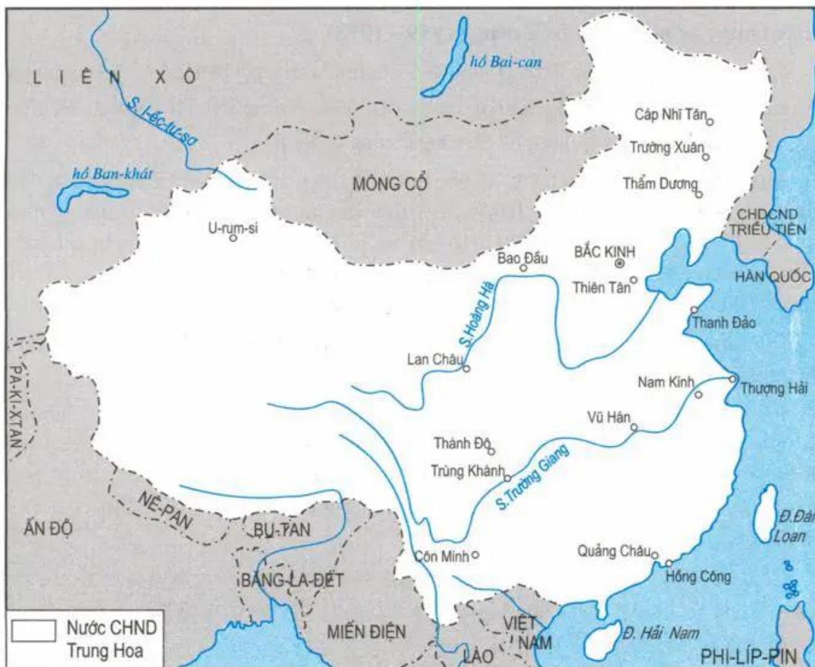
Hình 6. Lược đồ nước CHND Trung Hoa sau ngày thành lập

Công cuộc khôi phục kinh tế đã hoàn thành thắng lợi.