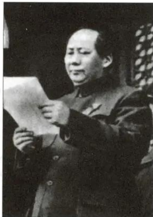
Hình 5. Chủ tịch Mao Trạch Đông tuyên bố thành lập nước CHND Trung Hoa

Sau khi nước Cộng hoà Nhân dân Trung Hoa được thành lập, nhiệm vụ to lớn nhất của nhân dân Trung Quốc là đưa đất nước thoát khỏi nghèo nàn lạc hậu, tiến hành công nghiệp hoá, phát triển kinh tế và xã hội.