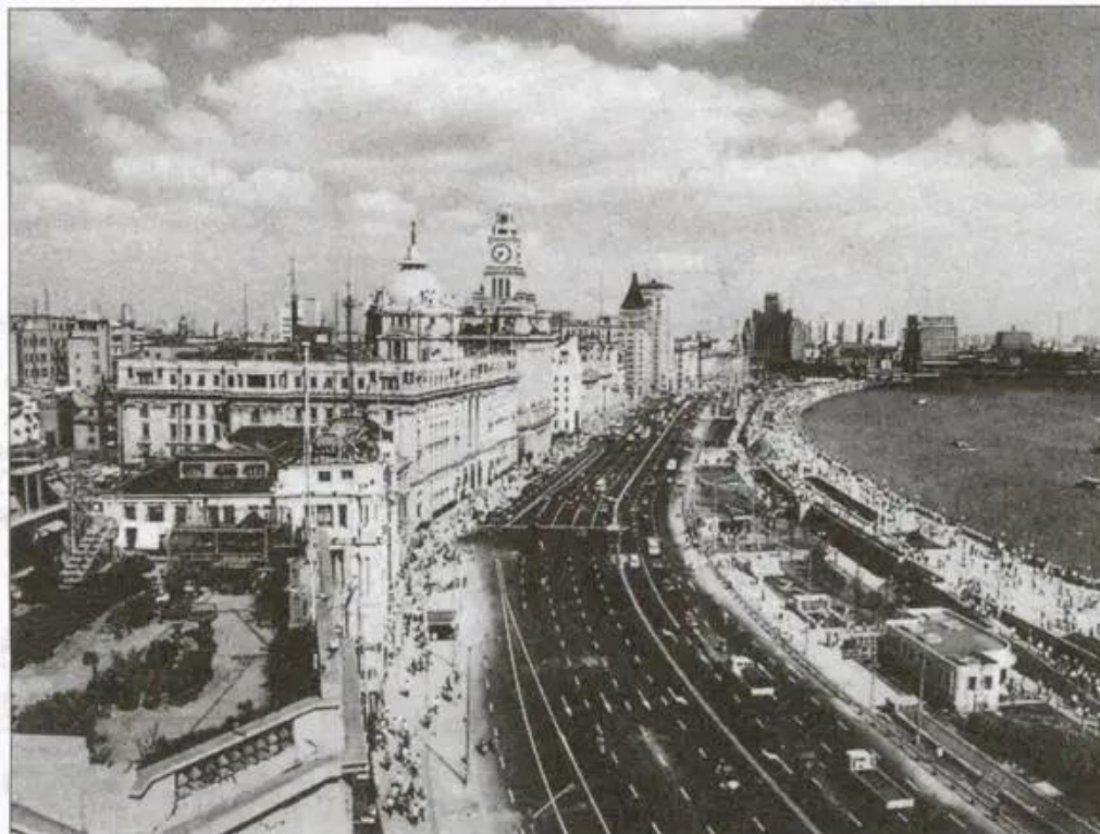
Hình 7. Thành phố Thượng Hải ngày nay

chủ trương xây dựng chủ nghĩa xã hội đặc sắc Trung Quốc, lấy phát triển kinh tế làm trung tâm, thực hiện cải cách và mở cửa nhằm mục tiêu hiện đại hoá, đưa đất nước Trung Quốc trở thành một quốc gia giàu mạnh, văn minh.