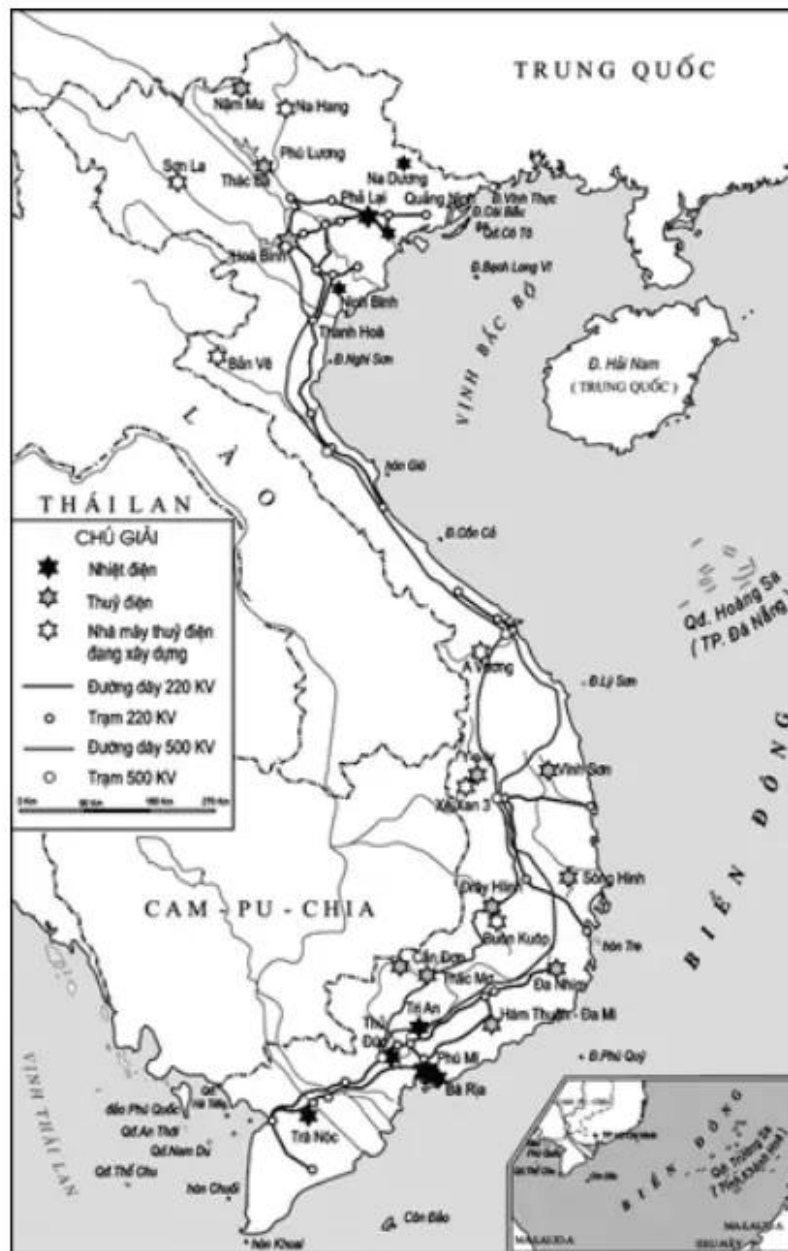
Công nghiệp điện Việt Nam