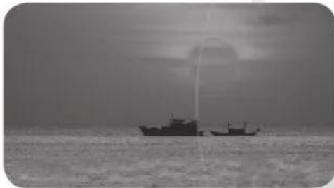
a) Mặt Trời đỏ rực như .....

3. Viết từ ngữ thích hợp với mỗi chỗ trống để tạo thành câu văn có hình ảnh so sánh: