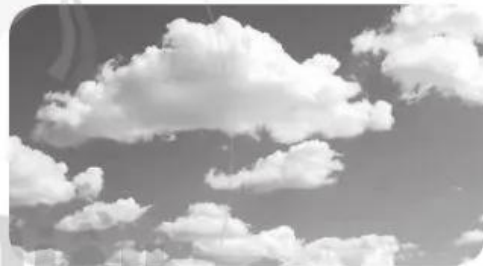
b) Trên trời mây trắng như .....