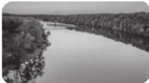
c) Dòng sông mềm mại như .....