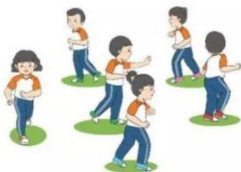
Trò chơi "Ai sẽ bị bắt?"

Quy cách thực hiện: Học sinh trong vòng tròn phải luôn đặt một chân trên điểm trung tâm đã được xác định trước và vươn người ra để chạm bạn khác. Học sinh đang chạy có thể né ra ngoài để tránh bạn mình chạm vào.