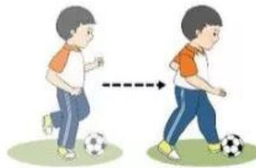
Di chuyển với bóng

Lưu ý: Giáo viên có thể nâng cao bài tập bằng cách giới hạn phạm vi di chuyển.