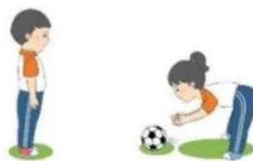
Luyện tập cá nhân – cặp đôi

+ Giáo viên cho học sinh nhóm thành cặp đôi với nhau và tiến hành thực hiện bài tung bóng lăn trên mặt đất: một học sinh hô và học sinh còn lại khống chế bóng.