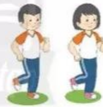
Chạy tại chỗ

– Chạy tại chỗ: Giáo viên cho học sinh chạy nhanh tại chỗ kết hợp đánh tay theo hiệu lệnh.