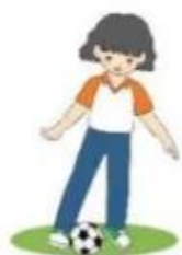
Tại chỗ giữ bóng

2. Tung bóng lăn trên mặt đất: Giáo viên cho học sinh bắt thành từng cặp và đứng đối diện nhau, trong đó một học sinh cầm bóng bằng hai tay. Sau hiệu lệnh, học sinh đó thực hiện tung bóng lăn sệt trên mặt đất đến bạn đối diện. Bạn đối diện cố gắng giữ bóng bằng tay khi bóng lăn tới vị trí của mình, sau đó tung bóng lăn lại cho bạn mình.