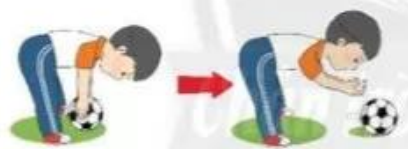
Tung bóng lăn trên mặt đất

1. Tung bóng bổng: Giáo viên cho học sinh đứng thành hàng ngang, mỗi học sinh cầm bóng bằng hai tay và để bóng dưới thấp. Sau hiệu lệnh, học sinh thực hiện tung bóng lên cao về phía trước.