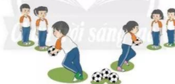
Trò chơi “Đưa bóng về tổ”

+ Cách chơi: Giáo viên cho học sinh xếp thành 2 – 3 hàng dọc đứng ở các vị trí khác nhau, bóng được đặt ở giữa và cách đều các nhóm. Sau hiệu lệnh, học sinh đầu hàng chạy nhanh tới vị trí đặt bóng, dùng hai tay cầm bóng chạy về vị trí nhóm mình rồi chạm vào tay bạn tiếp theo để tiếp tục thực hiện. Trong cùng thời gian, nhóm nào mang được nhiều bóng về là nhóm thắng cuộc. Để tăng tính linh hoạt cho học sinh, giáo viên có thể đặt bóng ở các vị trí khác nhau trên sân.