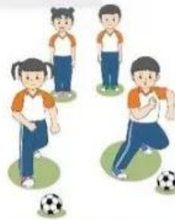
Luyện tập đồng loạt – theo nhóm

+ Giáo viên chia lớp thành các nhóm từ 8 – 10 học sinh, lần lượt học sinh thay phiên điều khiển nhóm thực hiện các động tác được học như bài chạm bóng tại chỗ và di chuyển chạm bóng.