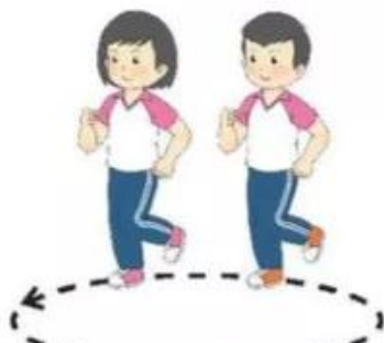
Chạy chậm theo vòng tròn

– Chạy chậm theo vòng tròn: Giáo viên cho học sinh chạy chậm theo vòng tròn.