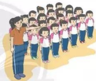
Tập hợp hàng ngang

– Động tác: Sau khi phát khẩu lệnh, người chỉ huy (giáo viên hoặc lớp trưởng) đứng vào vị trí định tập hợp, tay trái đưa sang ngang. Tổ trưởng tổ 1 nhanh chóng đứng bên trái, cùng hướng và cách người chỉ huy một cánh tay. Các tổ trưởng tổ 2, 3, 4, ... lần lượt tập hợp sau lưng tổ trưởng tổ 1. Các thành viên của từng tổ lần lượt tập hợp bên trái tổ trưởng của mình theo thứ tự từ thấp đến cao.