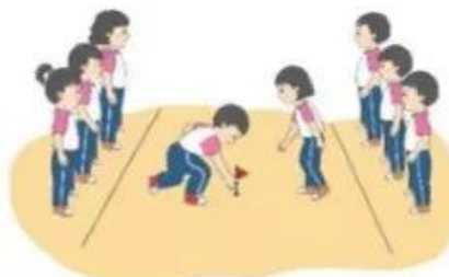
Trò chơi “Giành cờ”