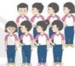
Luyện tập đồng loạt – theo nhóm

+ Giáo viên có thể cho các nhóm thi đua, thực hiện các nội dung đã học để những nhóm khác quan sát, nhận xét và đề xuất phương án sửa lỗi sai.