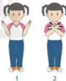
Vỗ tay theo nhịp

– Vỗ tay theo nhịp: Giáo viên cho học sinh đứng tại chỗ vỗ tay theo nhịp 1 – 2, 1 – 2,... (có thể sử dụng âm nhạc để thay thế nhịp đếm của giáo viên).