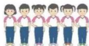
Dồn hàng ngang