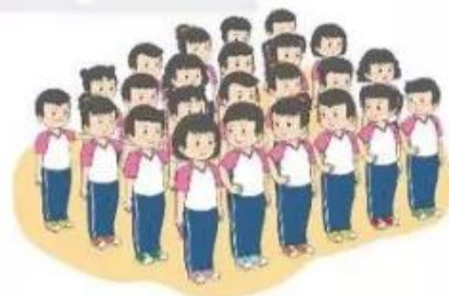
Dóng hàng ngang

– Động tác: Tổ trưởng tổ 1 đứng nghiêm làm chuẩn, mắt nhìn thẳng. Các thành viên tổ 1 lần lượt chống tay phải vào hông và di chuyển sao cho khuỷu tay phải vừa chạm vào tay trái người đứng bên cạnh, đồng thời đánh mặt sang phải dóng hàng ngang cho thẳng. Các tổ trưởng tổ 2, 3, 4, ... đặt đầu ngón tay trái chạm vào vai bạn đứng trước để đảm bảo cự li dọc, đồng thời nhìn vào gáy bạn phía trước để dóng hàng cho thẳng. Các thành viên tổ 2, 3, 4, ... nhìn tổ trưởng tổ mình để dóng hàng ngang và nhìn người đứng trước để dóng hàng dọc (không cần chống tay vào hông để dóng hàng như tổ 1).