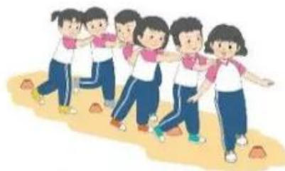
Trò chơi "Tay lái cừ khôi"

– Cách chơi: Giáo viên đặt các vật chuẩn theo đường thẳng, cách nhau 1 – 2 m. Chia lớp thành 2 – 3 nhóm đều nhau và đứng sau vạch xuất phát. Tất cả học sinh trong nhóm đặt hai tay lên vai bạn đứng trước. Khi có hiệu lệnh, các nhóm di chuyển vòng qua các vật chuẩn để về đích. Nhóm nào về đích trước và không phạm luật là nhóm thắng cuộc (ví dụ: tay không rời khỏi vai bạn, các vật chuẩn không bị xô dịch).