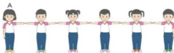
Dàn hàng ngang