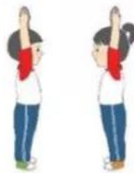
Luyện tập cá nhân – cặp đôi

+ Trong quá trình tập luyện, học sinh có thể quan sát và sửa sai cho bạn cùng tập, qua đó giúp phát triển năng lực giao tiếp và tập cho học sinh biết giúp đỡ lẫn nhau.