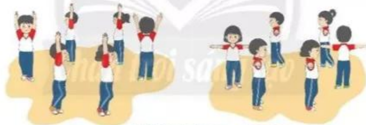
Đi kết hợp tay lên cao – dang ngang

– Đi kết hợp tay lên cao – dang ngang: Giáo viên cho học sinh đi vòng tròn kết hợp thực hiện động tác đưa hai tay lên cao và dang ngang theo hiệu lệnh (tiếng còi).