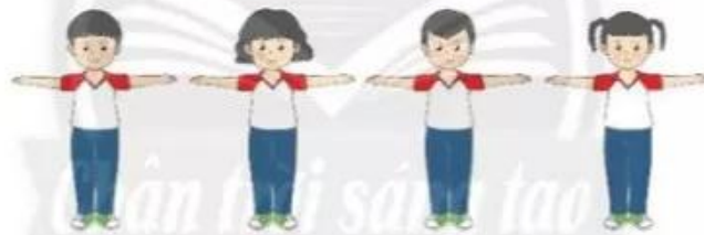
Luyện tập đồng loạt – theo nhóm

+ Giáo viên quan sát, hướng dẫn và điều chỉnh động tác cho từng nhóm khi cần thiết. Có thể cho các nhóm thi đua với nhau xem nhóm nào thực hiện động tác tốt nhất (một nhóm thực hiện, các nhóm còn lại quan sát, nhận xét).