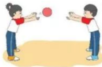
Trò chơi “Tung bóng qua lại”

– Cách chơi: Giáo viên cho học sinh xếp thành hai hàng dọc đứng đối diện nhau, cách nhau 3 – 5 m, sau đó phát cho mỗi cặp học sinh đứng đối diện nhau một quả bóng. Khi có hiệu lệnh, hai học sinh tung bóng qua lại với nhau, nhóm nào để bóng rơi xuống hoặc di chuyển ra xa hàng của mình là nhóm thua cuộc (giáo viên có thể vẽ vòng tròn cho học sinh đứng vào).