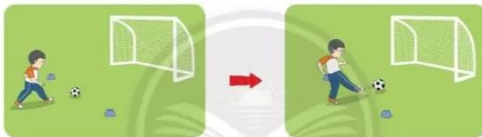
Di chuyển đá bóng cố định vào cầu môn

4. Di chuyển đá bóng cố định vào cầu môn: Học sinh chạy từ vạch xuất phát đến vị trí đặt bóng định sẵn và đá bóng vào cầu môn.