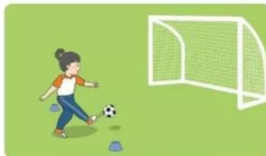
Đá bóng cố định vào cầu môn

3. Đá bóng cố định vào cầu môn: Giống bài tập tại chỗ đá bóng cố định, nhưng học sinh phải cố gắng đá bóng vào cầu môn.