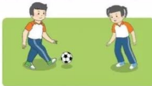
Luyện tập cá nhân – cặp đôi

+ Trong quá trình luyện tập, học sinh có thể quan sát và sửa sai cho bạn cùng tập, giúp phát triển năng lực giao tiếp và tập cho học sinh biết giúp đỡ nhau.