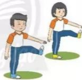
Tại chỗ đá lăng

– Tại chỗ đá lăng: Giáo viên cho cả lớp xếp thành 2 – 3 hàng ngang cách nhau một sải tay thực hiện động tác đá lăng lần lượt từng chân ra trước.