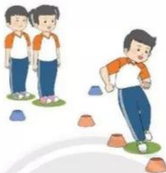
Trò chơi "Chạy luồn vật chuẩn"

– Cách chơi: Giáo viên cho học sinh xếp thành hai hàng dọc số lượng bằng nhau, cách nhau 1 m, đứng sau vạch xuất phát. Sau hiệu lệnh, học sinh đầu mỗi hàng chạy nhanh luồn các vật chuẩn đặt cách nhau 2 m theo đường thẳng. Cứ như vậy cho đến hết.