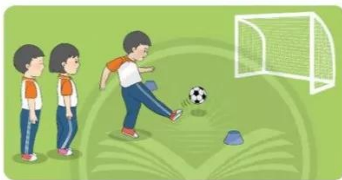
Trò chơi “Đá bóng vào cầu môn”

+ Cách chơi: Giáo viên chia học sinh thành 2 nhóm xếp hàng dọc đứng trước vạch xuất phát, bóng được đặt trước cầu môn 5 m và cách vạch xuất phát 7 – 10 m. Mỗi nhóm sẽ có 3 – 5 phút để tham gia trò chơi, thực hiện lần lượt từng nhóm. Sau hiệu lệnh, học sinh mỗi nhóm lần lượt thực hiện động tác chạy và đá bóng vào cầu môn, thực hiện xong phải nhanh chóng đặt bóng lại vị trí cũ để bạn tiếp theo thực hiện. Nhóm nào đá được nhiều bóng vào cầu môn nhất là nhóm thắng cuộc.