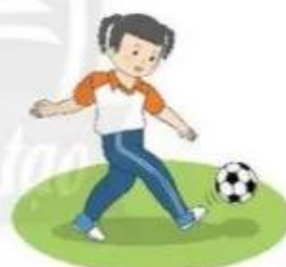
Tại chỗ đá bóng cố định

Giáo viên có thể thay đổi khoảng cách (3 bước hoặc 7 bước) để tăng độ khó bài tập.