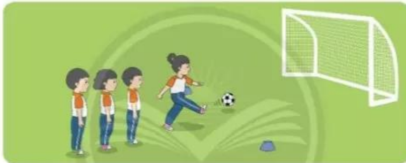
Luyện tập đồng loạt – theo nhóm

+ Giáo viên có thể cho các nhóm thi đua, thực hiện động tác cho các nhóm khác quan sát, nhận xét và đề xuất phương án sửa lỗi sai.