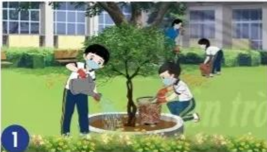
1 Lớp Nam thực hành chăm sóc cây ở vườn trường.