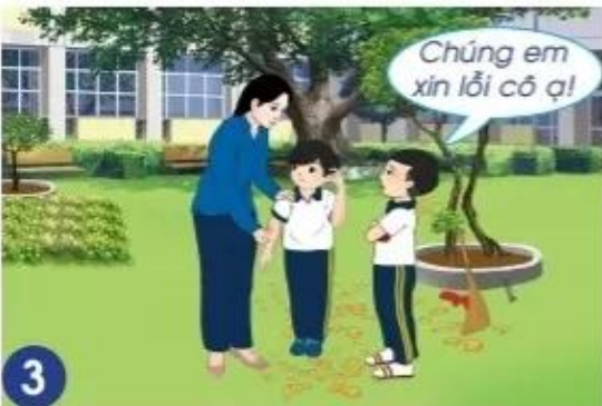
3 Cô giáo nhắc nhở hai bạn.