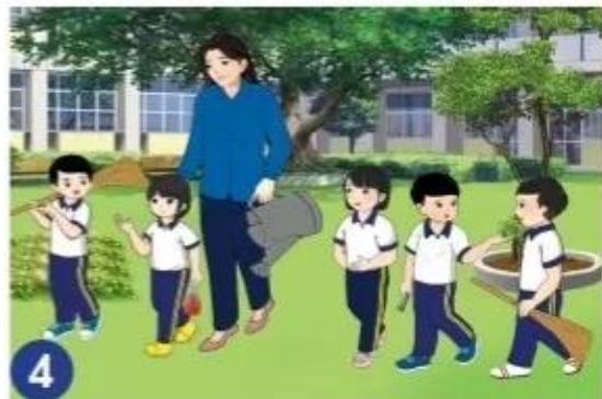
4 Các bạn dọn dẹp vệ sinh, cất dụng cụ lao động gọn gàng.