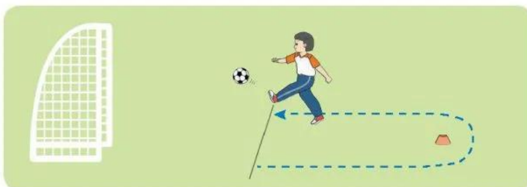
Dẫn bóng vòng vật chuẩn và đá bóng vào cầu môn

– Động tác : Khi nghe hiệu lệnh, học sinh từ vạch xuất phát dẫn bóng vòng qua vật chuẩn rồi tiếp tục dẫn đến vị trí cũ rồi thực hiện đá bóng vào cầu môn.