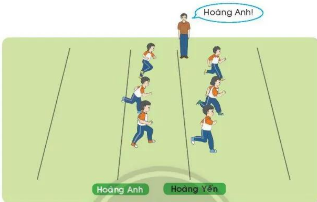
Trò chơi "Hoàng Anh - Hoàng Yến"