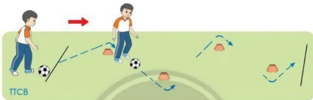
Dẫn bóng theo đường gấp khúc

– Động tác : Khi có hiệu lệnh, học sinh từ vạch xuất phát dẫn bóng chậm đến các vật chuẩn thì chuyển hướng, luân phiên chuyển hướng trái – phải cho đến đích.