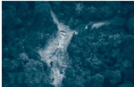
Một khoảng rừng Amazon bị chặt phá.

Rừng mưa nhiệt đới Amazon đang bị tàn phá nghiêm trọng. Số liệu thống kê của Viện Nghiên cứu vũ trụ quốc gia Brazil cho thấy khoảng 12 287 km 2 diện tích rừng nhiệt đới Amazon đã bị chặt phá trong vòng 12 tháng (tính từ tháng 8-2018 đến tháng 7-2019). Đây là mức cao nhất trong hơn 10 năm qua. (Theo TTXVN).