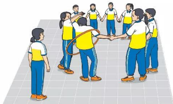
Hình 2. Trò chơi Chuyền vòng