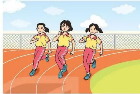
Hình 2. Chạy giữa quãng trên đường vòng