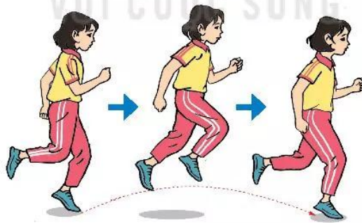
Hình 1. Kĩ thuật chạy giữa quãng trên đường thẳng