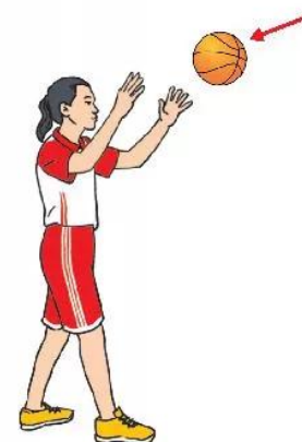
Hình 3. Tại chỗ bắt bóng hai tay trước ngực

(Hoạt động cá nhân, cặp đôi, theo nhóm, cả lớp)