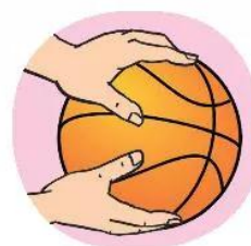
Hình 1. Cách cầm bóng