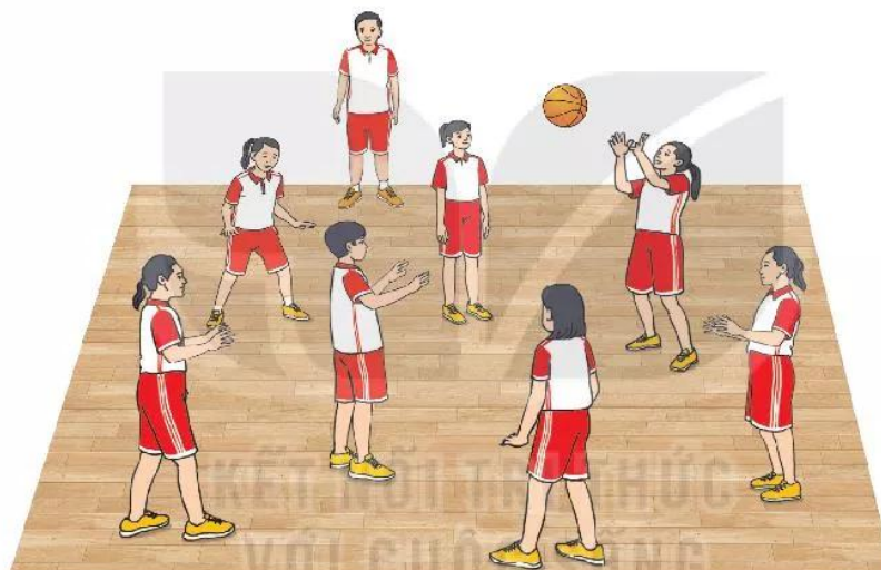
Hình 4. Trò chơi Giành bóng