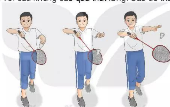
Hình 1. Kĩ thuật phát cầu trái tay