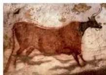
Hình trong hang Altamira, Tây Ban Nha

Quan sát hình và chỉ ra cách vẽ mô phỏng theo hình mẫu.