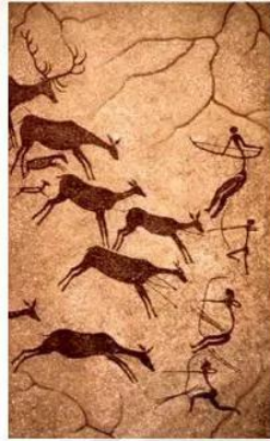
Hình vẽ trong hang Lascaux (Pháp)

Kĩ thuật vẽ đơn giản. Họ khắc nét vào vách đá rồi dùng ống sậy thổi màu vào từng mảng hình khắc, cũng có thể họ dùng tay hoặc ống sậy, que, lông thú (lợn rừng, thỏ, ngựa,...) để vẽ hoặc dùng hình khắc trên đất sét đắp lên thành hang.