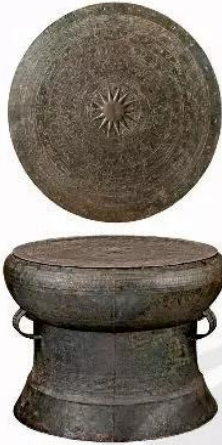
Ảnh: Trống đồng Ngọc Lũ, LSb.5722, Bảo tàng Lịch sử Quốc gia Việt Nam

Hình vẽ trên trống đồng được thể hiện đơn giản, chặt chẽ, mang tính cách điệu bằng những đường kẻ (nét thẳng và nét cong,...). Đối tượng thể hiện thường là các hoạt động của con người (hình người già gào, chèo thuyền, thổi khèn, vũ nữ, chiến binh) hay chim, thú, nhà, sóng nước,... phản ánh cuộc sống lao động, tín ngưỡng và vui chơi của các cư dân thời Hùng Vương.