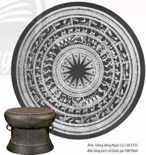
Ảnh: Trống đồng Ngọc Lũ, (Sb.572) Bảo tàng Lịch sử Quốc gia Việt Nam