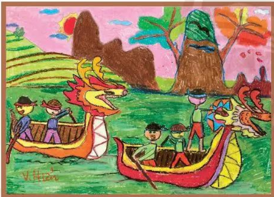
Sản phẩm của học sinh: Vinh Hiền (Hà Nội), Đua thuyền rồng, màu sáp.