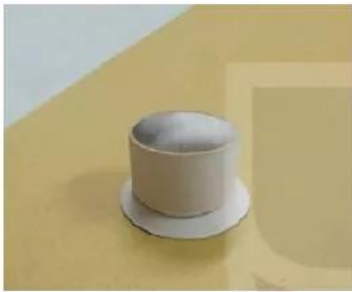
4. Dùng keo gắn khối trụ vào đế tròn.