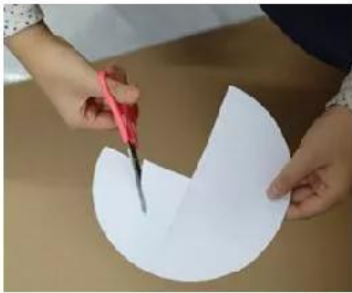
1. Cắt bìa tạo khối chóp cụt.