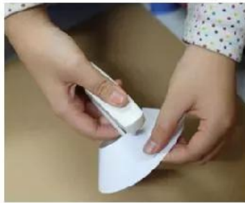
2. Ghim cố định để tạo khối.