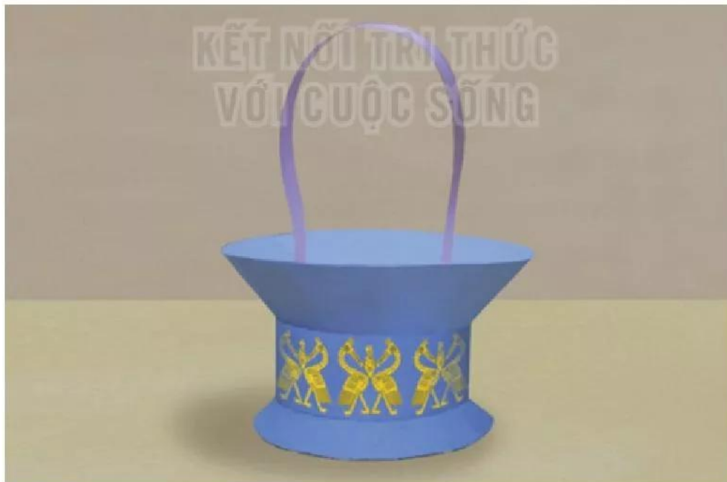
7. Tô màu, vẽ họa tiết trang trí.