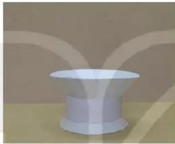
5. Dùng keo gắn các khối để tạo thân lồng hoa.