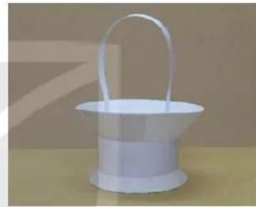
6. Tạo quai xách.