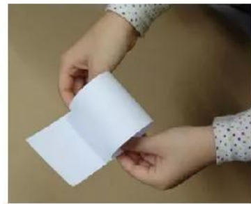
3. Tạo khối trụ.