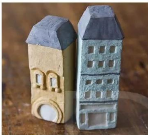
Lương Thành Công (Thái Bình), sản phẩm mỹ thuật đa chất liệu