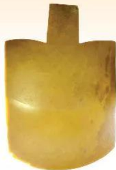
Riu, văn hoá Phùng Nguyên