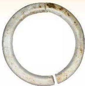
Vòng tay, văn hoá Phùng Nguyên