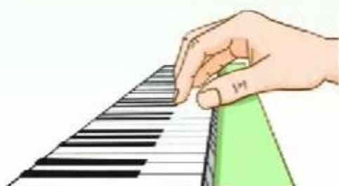
Bấm và ngắt âm trên phím kèn