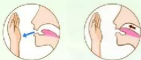
Thổi và ngắt âm bằng lưỡi