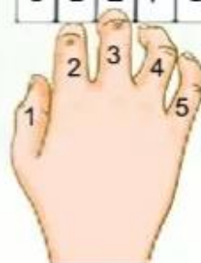
Sơ đồ ngón bấm

c. Bảo quản kèn phím, vệ sinh ống thổi trước và sau khi sử dụng.