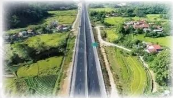
Đường cao tốc Bắc Giang – Lạng Sơn