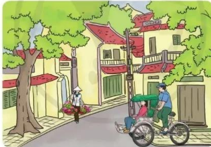
Một phố ở Hà Nội ngày xưa