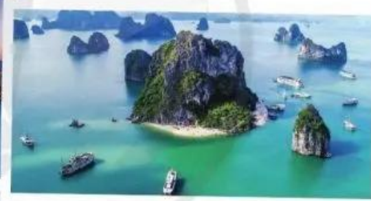
Vịnh Hạ Long (Quảng Ninh)