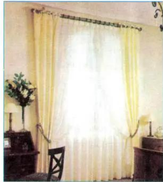
Hình 2.13 - Một số kiểu rèm.