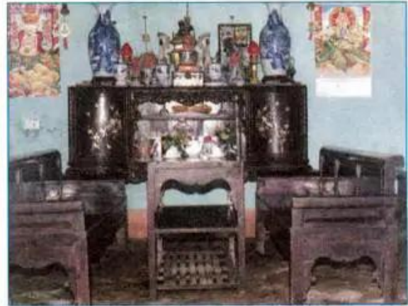
Hình 2.11 - Trang trí nhà ở bằng tranh ảnh.