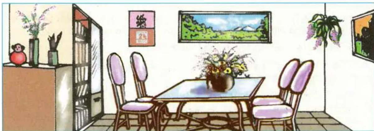
Hình 2.22 - Sự phù hợp giữa bình hoa và vị trí trang trí.

Quan sát hình 2.22, em hãy nhận xét về cách đặt bình hoa ở các vị trí đó đã phù hợp chưa và giải thích (hoa treo tường, để bàn, đặt trên giá sách).