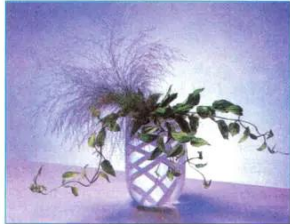
Hình 2.20 - Sự phù hợp giữa hoa và bình cắm.