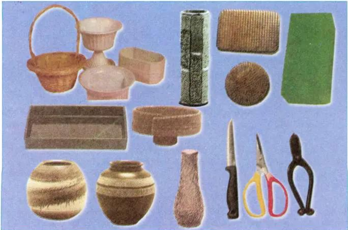
Hình 2.19 - Dụng cụ cắm hoa.