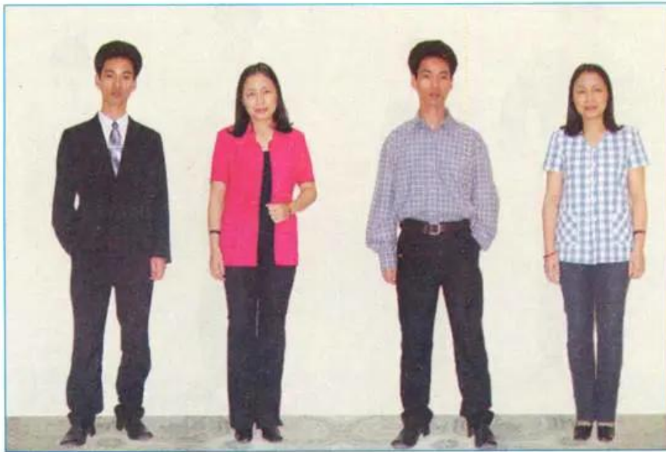
Hình 1.6 - Ảnh hưởng của kiểu may đến vóc dáng người mặc.

Dựa vào kiến thức ở bảng 3 và quan sát hình 1.6, hãy nêu nhận xét về ảnh hưởng của kiểu may đến vóc dáng người mặc.