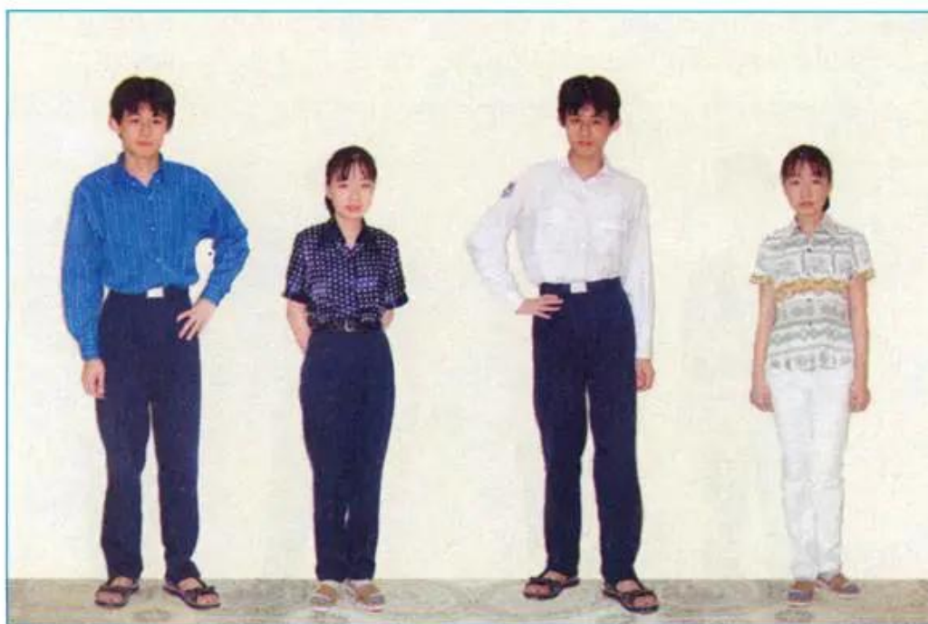
Hình 1.5 - Ảnh hưởng của màu sắc và hoa văn của vải đến vóc dáng người mặc.

Hãy quan sát hình 1.5 và nêu nhận xét về ảnh hưởng của màu sắc, hoa văn của vải đến vóc dáng người mặc.