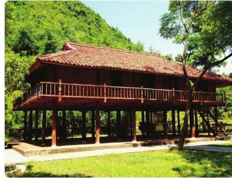
Hình 1.11. Nhà sàn