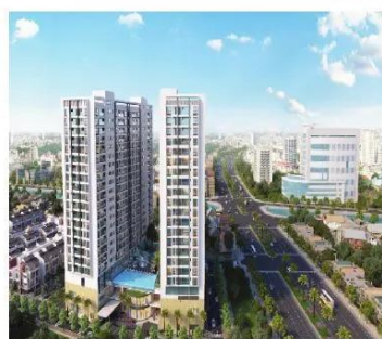
Hình 1.7. Chung cư

2. Kiểu nhà ở đô thị (biệt thự, nhà phố, nhà liền kề, chung cư,...) được xây dựng chủ yếu bằng các nguyên vật liệu nhân tạo như gạch, xi măng, bê tông, thép,... (Hình 1.7 đến Hình 1.9). Bên trong ngôi nhà thường được phân chia thành các phòng nhỏ. Ngôi nhà thường có nhiều tầng và được trang trí nội thất hiện đại, đẹp, tiện nghi trong mỗi khu vực.