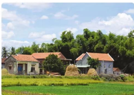
Hình 1.5. Nhà mái ngói ở Đồng bằng Bắc Bộ

1. Kiểu nhà ở nông thôn (nhà mái ngói, nhà mái tranh,...) được xây dựng chủ yếu bằng các nguyên vật liệu tự nhiên có tại địa phương (các loại lá, gỗ, tre, nứa,...) và gạch, ngói (Hình 1.5, 1.6). Ngôi nhà thường không được ngăn chia thành các phòng nhỏ như phòng ăn, phòng khách,... Người ta thường xây thêm nhà phụ, là nơi nấu ăn và để dụng cụ lao động.