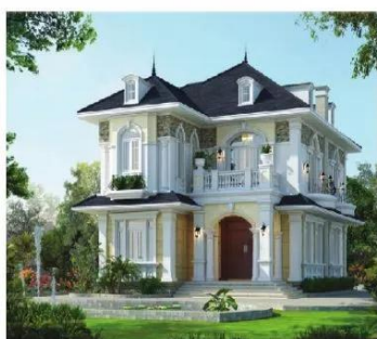
Hình 1.8. Biệt thự