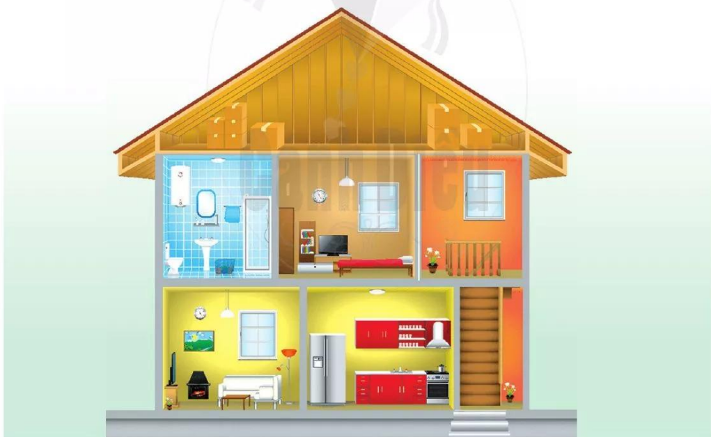
Hình 1.3. Nhà ở của con người thời kì hiện đại

Khi xã hội ngày càng tiến bộ, nhờ sự phát triển của công cụ lao động và sản xuất, con người mong muốn định cư lâu dài, nhà ở được xây dựng từ đơn sơ đến kiên cố bằng các vật liệu như tre, gỗ, đất, đá, gạch,... để phục vụ cho các nhu cầu sinh hoạt, nghỉ ngơi, giải trí nhằm bảo vệ sức khỏe. Ngoài ra, nhà ở còn là nơi chứa đồ, bảo vệ tài sản của con người, nơi gắn kết giữa các thành viên trong gia đình và cũng có thể là nơi làm việc, học tập của con người (Hình 1.3).