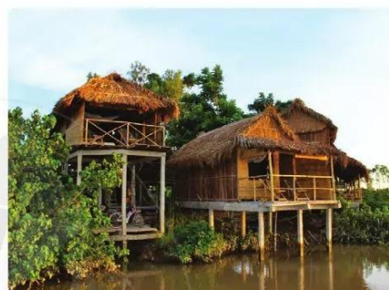
Hình 1.6. Nhà trên cọc (nhà trên kênh, rạch) ở Đồng bằng sông Cửu Long

2. Kiểu nhà ở đô thị (biệt thự, nhà phố, nhà liền kề, chung cư,...) được xây dựng chủ yếu bằng các nguyên vật liệu nhân tạo như gạch, xi măng, bê tông, thép,... (Hình 1.7 đến Hình 1.9). Bên trong ngôi nhà thường được phân chia thành các phòng nhỏ. Ngôi nhà thường có nhiều tầng và được trang trí nội thất hiện đại, đẹp, tiện nghi trong mỗi khu vực.