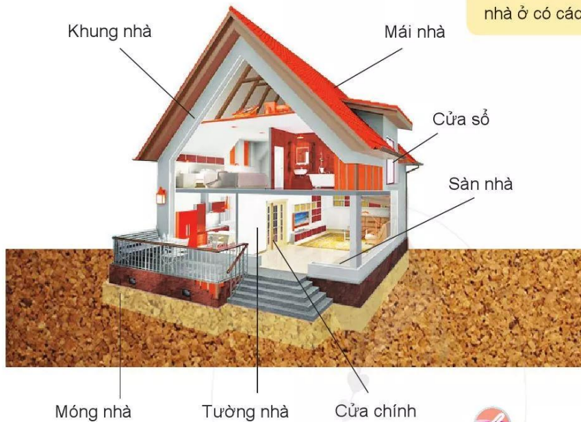
Hình 1.4. Các phần chính của nhà ở