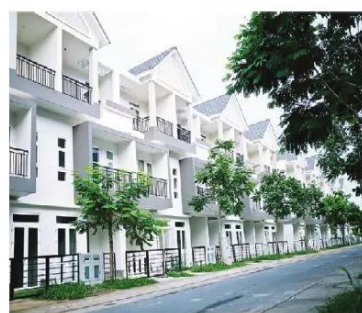
Hình 1.9. Nhà liền kề