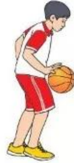
Hình 1. Dẫn bóng tại chỗ