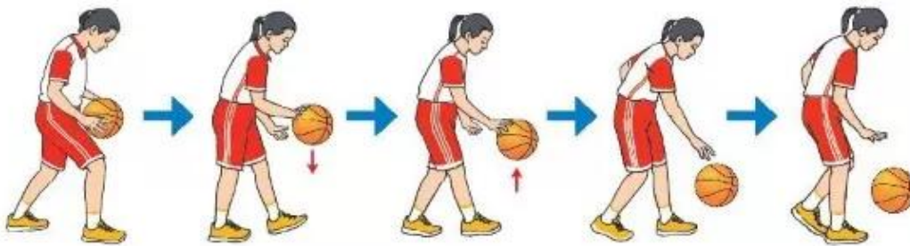
Hình 2. Dẫn bóng trên đường thẳng