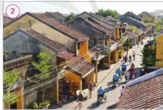
Phố cổ Hội An, tỉnh Quảng Nam