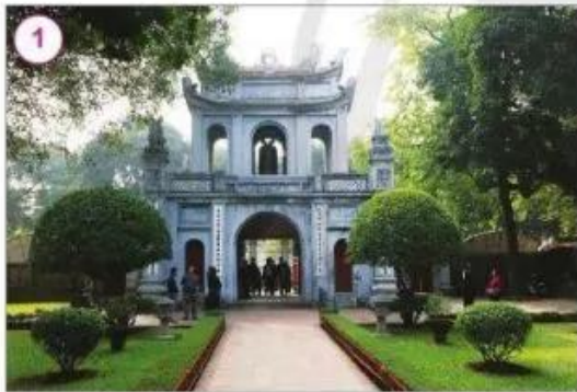
Văn Miếu – Quốc Tử Giám, Thủ đô Hà Nội

Hãy nói về một số di tích lịch sử – văn hoá hoặc cảnh quan thiên nhiên của đất nước Việt Nam.