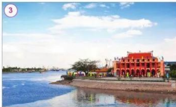
Bến Nhà Rồng, Thành phố Hồ Chí Minh