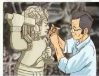
2 Điêu khắc đá