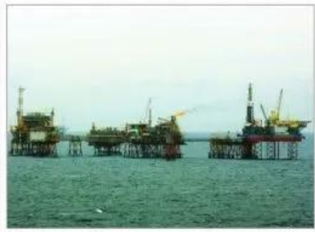
5 Khai thác dầu khí