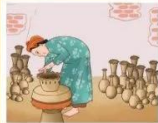
3 Làm gốm