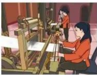
1 Dệt lụa

Hãy nói về những hoạt động sản xuất thủ công trong các hình dưới đây. Các hoạt động đó mang lại ích lợi gì?