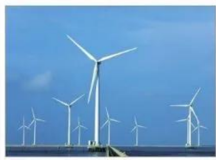
6 Sản xuất điện gió