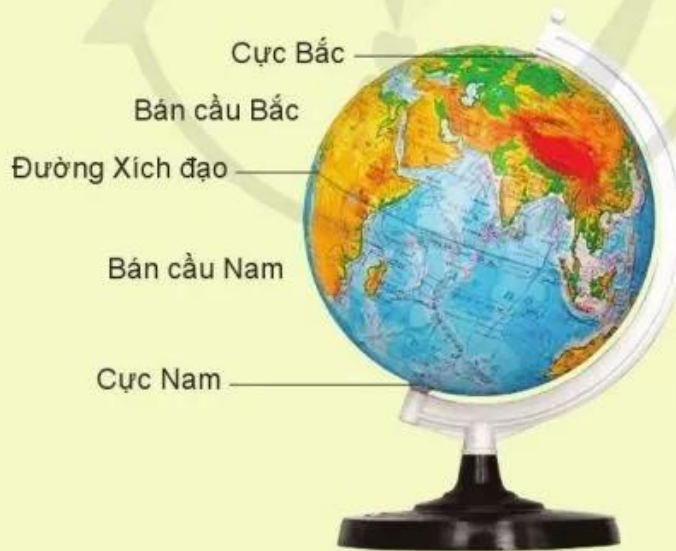
Quả địa cầu