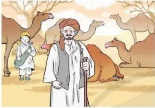
Chăn nuôi lạc đà