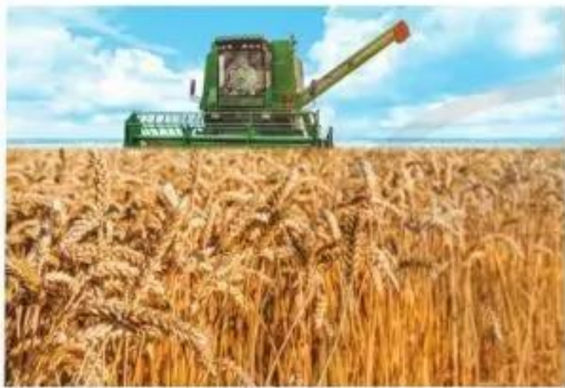
Thu hoạch lúa mì