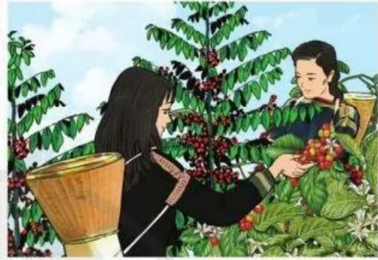
Thu hái cà phê