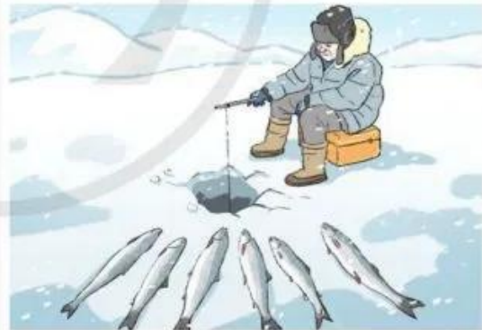
Câu cá ở hồ băng