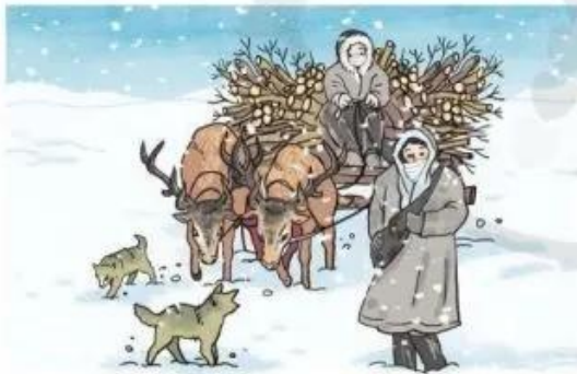
Đi lấy củi