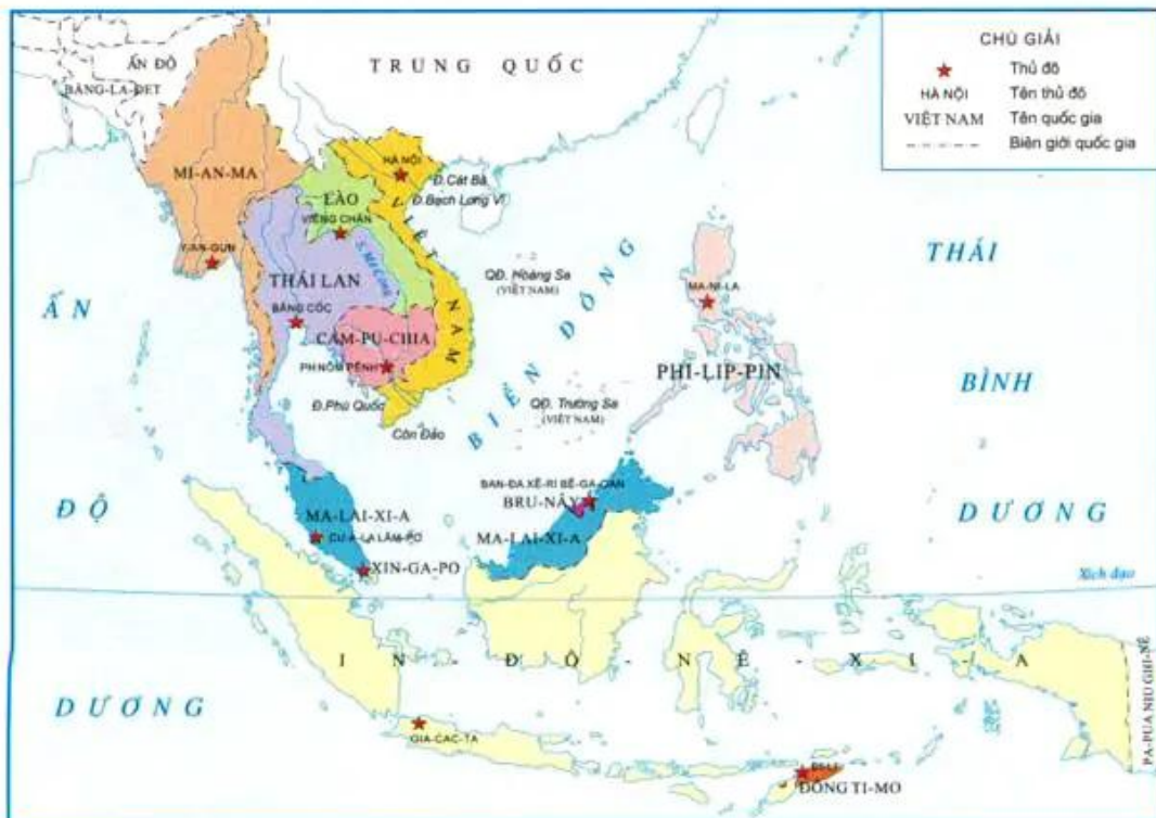
Hình 1. Lược đồ Việt Nam trong khu vực Đông Nam Á

+ Kể tên một số đảo và quần đảo của nước ta.