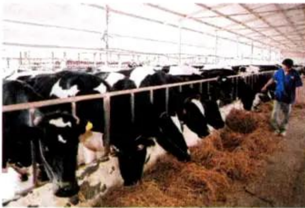
Hình 2. Chăn nuôi bò