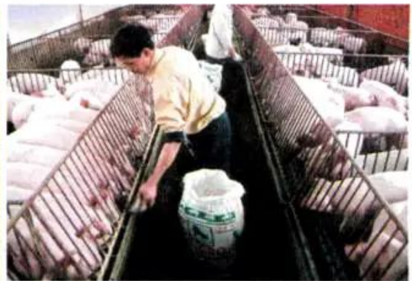
Hình 3. Chăn nuôi lợn

Tuy nhiên, chúng ta cần chú ý hơn tới việc phòng chống bệnh dịch cho gia súc, gia cầm để ngành chăn nuôi phát triển ổn định, vững chắc.