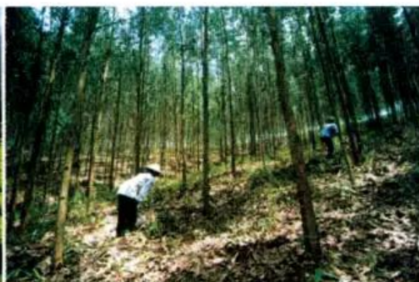
Hình 3. Chăm sóc rừng