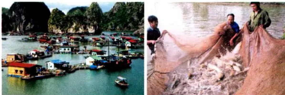
Hình 5. Nuôi và thu hoạch thủy sản

– Em hãy kể tên các loại thủy sản đang được nuôi nhiều ở nước ta.