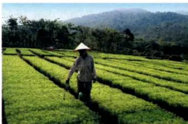
Hình 2. Ươm cây giống để trồng rừng

Trước đây, nước ta có rất nhiều rừng. Do khai thác bừa bãi, hàng triệu héc ta rừng đã trở thành đất trống, đồi núi trọc. Nhà nước đã và đang vận động nhân dân trồng và bảo vệ rừng nên diện tích rừng của nước ta đã tăng lên đáng kể.