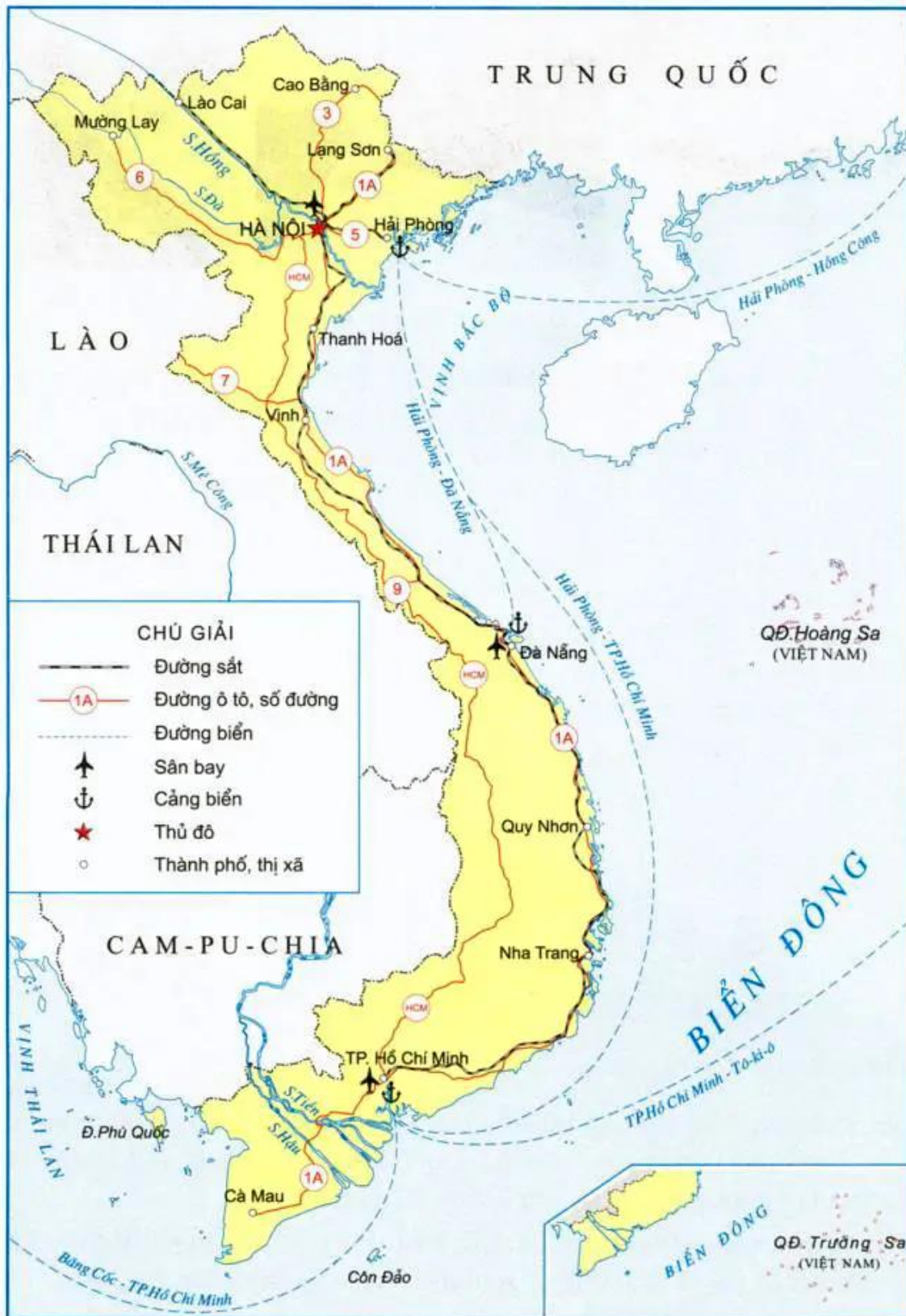
Hình 2. Lược đồ giao thông vận tải