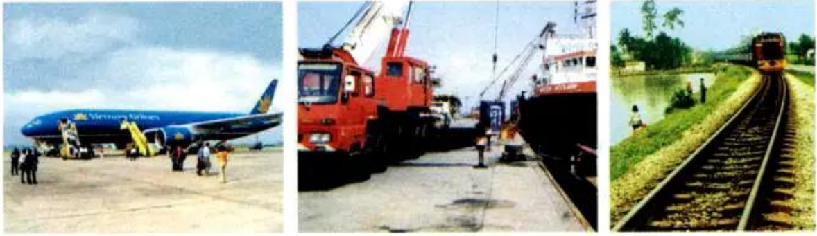
Hình 3. Một số phương tiện giao thông vận tải

Nước ta có nhiều loại hình giao thông vận tải. Đường sắt Bắc - Nam và quốc lộ 1A là hai tuyến đường sắt và đường bộ dài nhất của đất nước.