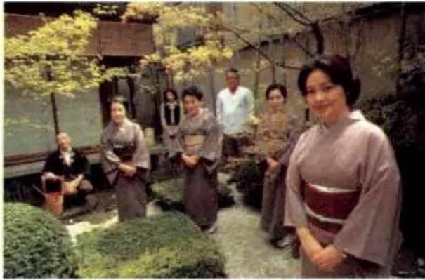
a) Người dân Đông Á (Nhật Bản)

– Đọc bảng số liệu ở bài 17, so sánh dân số châu Á với dân số của các châu lục khác.