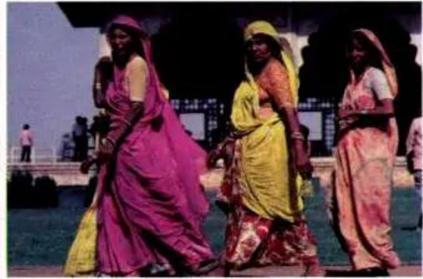
b) Người dân Nam Á (Ấn Độ)