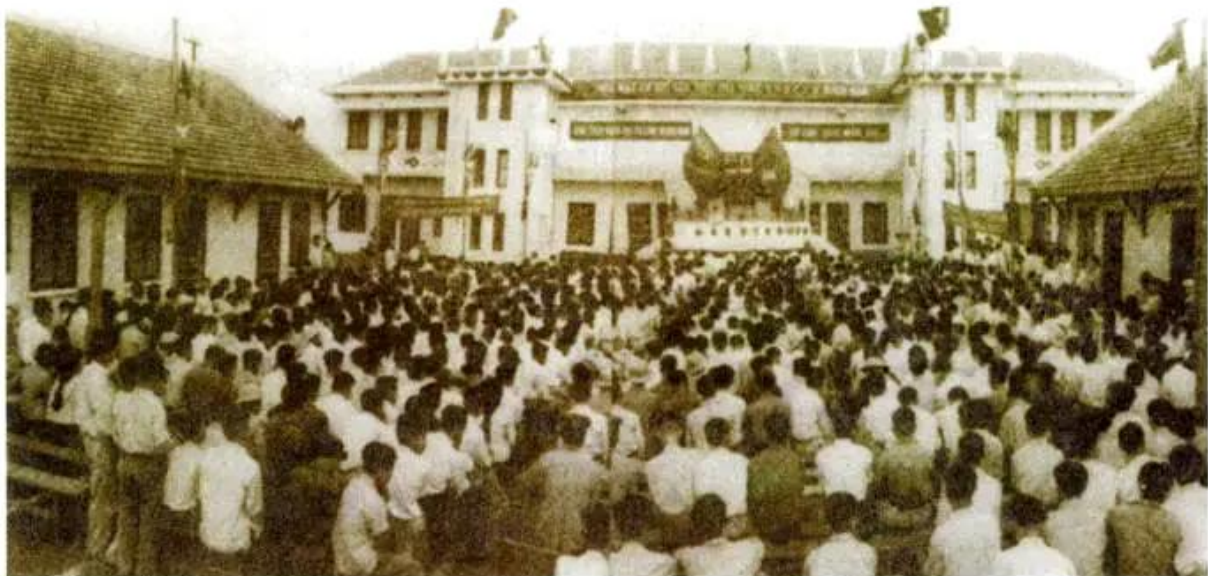
Hình 1. Lễ khánh thành Nhà máy Cơ khí Hà Nội

Sau gần 1000 ngày đêm lao động kiên trì, gian khổ, tháng 4 - 1958, lễ khánh thành nhà máy diễn ra trong niềm hân hoan phấn khởi của cán bộ Đảng, Nhà nước ta cùng với các chuyên gia Liên Xô và đặc biệt là của đồng bào Thủ đô. Nhà máy Cơ khí Hà Nội đồ sộ vươn cao trên vùng đất trước đây là một cánh đồng, có nhiều đôn bốt và hàng rào dây thép gai của thực dân xâm lược.