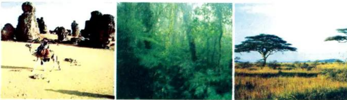
a) Hoang mạc

Vì nằm trong vòng đai nhiệt đới, diện tích rộng lớn, lại không có biển ăn sâu vào đất liền, nên châu Phi có khí hậu nóng và khô bậc nhất thế giới.