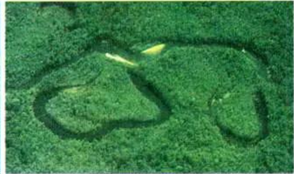
d) Sông A-ma-dôn (Bra-xin)