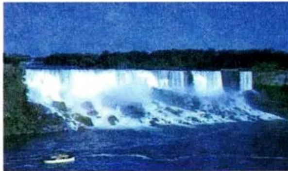
c) Thác Ni-a-ga-ra (Hoa Kì)