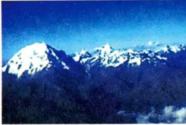
a) Núi An-đét (Pê-ru)

– Quan sát các ảnh trong hình 2, rồi tìm trên hình 1 các chữ cái a, b, c, d, e, g, cho biết các ảnh đó được chụp ở Bắc Mĩ, Trung Mĩ hay Nam Mĩ.