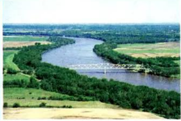
b) Đồng bằng Trung tâm (Hoa Kì)