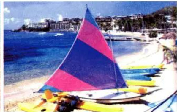
g) Một bãi biển ở vùng biển Ca-ri-bê