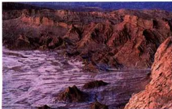
e) Hoang mạc A-ta-ca-ma (Chi-lê)