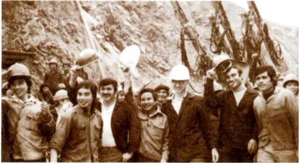
Hình 1. Niềm vui do vượt mức kế hoạch của công nhân xây dựng Nhà máy Thủy điện Hoà Bình

– Em nghĩ gì về những số liệu nói trên ?