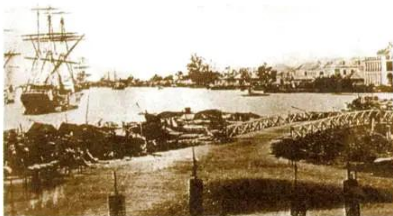
Hình 1. Bến cảng Nhà Rồng đầu thế kỉ XX