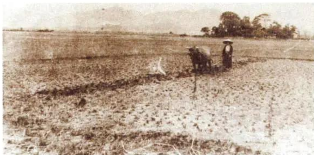
Hình 2. Người nông dân Hà Tĩnh được cày trên thửa ruộng do chính quyền Xô viết chia trong những năm 1930 - 1931

Suốt thời kì có chính quyền nhân dân, ở các thôn xã không hề xảy ra trộm cắp. Những phong tục lạc hậu như mê tín dị đoan bị bãi bỏ, tệ cờ bạc,... cũng bị đả phá. Đặc biệt là chính quyền cách mạng đã tịch thu ruộng đất của địa chủ chia cho nông dân, xoá bỏ các thứ thuế vô lí. Nhân dân ở các thôn, xã vui mừng, phấn khởi. Nghe tiếng trống báo tin, bà con nô nức ra đình làng nghe nói chuyện, nghe giải thích chính sách hoặc bàn bạc công việc chung. Ai cũng thấy mình được thoát khỏi ách nô lệ, trở thành người chủ thôn xóm.