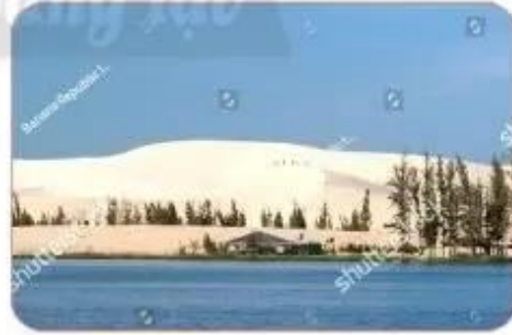
đồi cát trắng