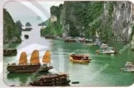
vịnh Hạ Long