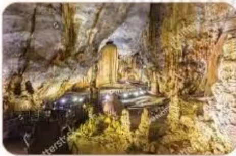
động Thiên Đường