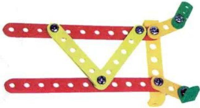
Hình 2. Khung sàn xe và các giá đỡ