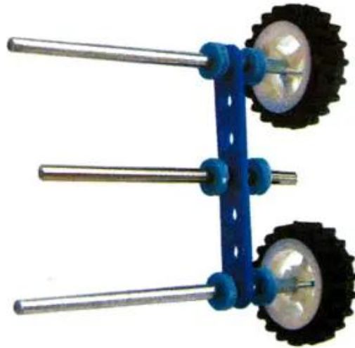
Hình 4. Hệ thống giá đỡ trục bánh xe sau