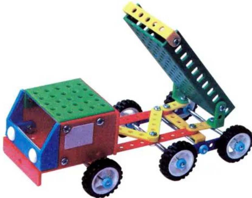
Hình 1. Xe ben