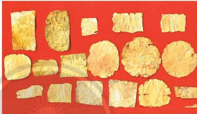
13.3 Những mảnh vàng thuộc văn hoá Óc Eo (di chỉ Gò Tháp, Đồng Tháp)