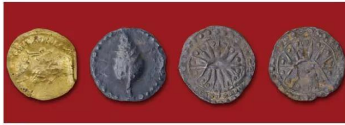
13.1 Những đồng tiền của nhiều khu vực khác nhau trên thế giới được tìm thấy ở các cảng thị của vương quốc Phù Nam.

Trâm hương là một sản vật có giá trị dùng để làm cống phẩm và trao đổi, mua bán với nước ngoài. Xưa kia, vùng Kau-tha-ra (Kauthara) (Khánh Hoà) vẫn được gọi là “xứ trâm hương”.