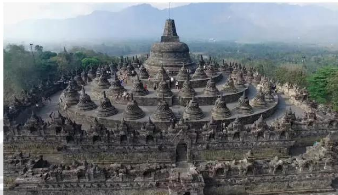
13.8 Quần thể kiến trúc Phật giáo Bô-rô-bu-đua, thế kỉ VIII

Văn hoá Ấn Độ lan toả đến Đông Nam Á đã góp phần tạo nên một nền nghệ thuật độc đáo của khu vực. Khu đền tháp Mỹ Sơn (Việt Nam) và quần thể Bô-rô-bu-đua (Borobudur, In-đô-nê-xi-a) là hai công trình kiến trúc tiêu biểu của Đông Nam Á trước thế kỉ X.