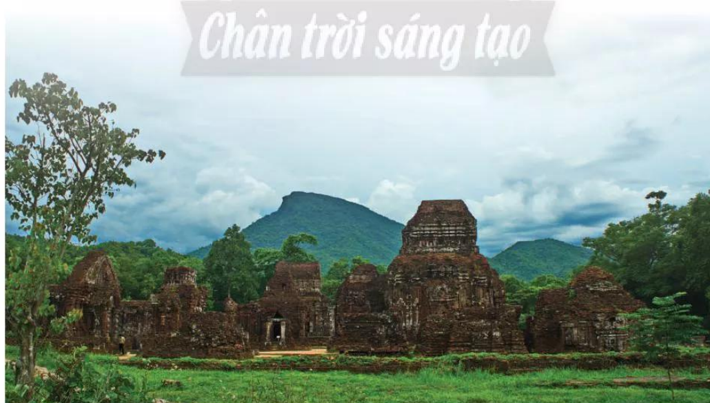
13.6 Di tích đền tháp Mỹ Sơn (Quảng Nam) của vương quốc Chăm-pa, xây dựng từ thế kỉ IV đến thế kỉ XIV

Phù Nam, các vương quốc trên đảo Xu-ma-tra, đảo Gia-va và vương quốc Pa-gan của người Miến chịu ảnh hưởng từ Phật giáo. Trong khi đó, Hin-đú giáo lại khá phổ biến ở Chăm-pa, Chân Lạp.