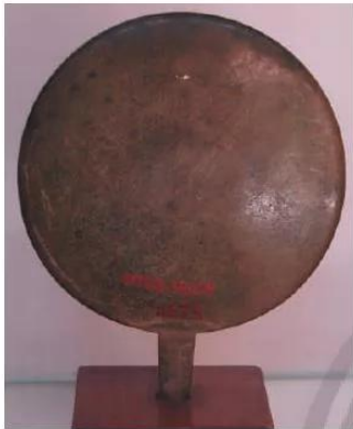
13.2 Gương đồng thời Hán, Trung Quốc (di chỉ Ốc Eo, An Giang)