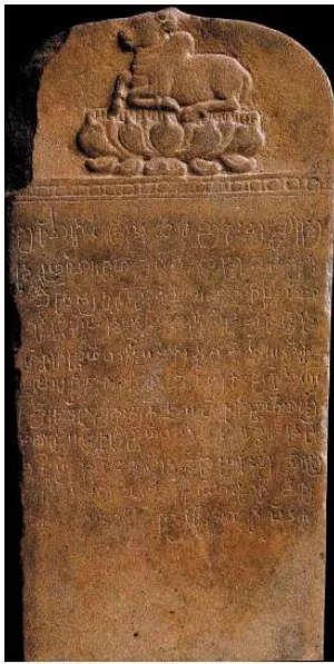
13.7 Chữ cổ Khơ-me (Khmer) khắc trên bia ở Kan-đa (Kanda), Cam-pu-chia, thế kỉ VII – VIII