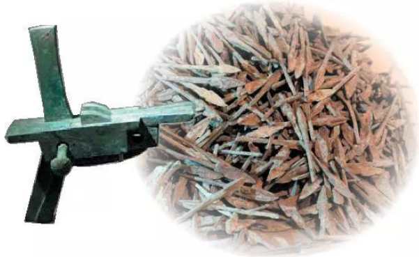
14.5 Lấy nõ và mũi tên đồng Cổ Loa (Đông Anh, Hà Nội)