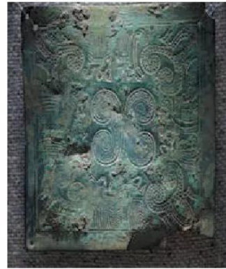
14.6 Mảnh giáp che trước ngực bằng đồng thời Âu Lạc

Đầu thế kỉ II TCN, Âu Lạc nhiều lần bị quân của Triệu Đà – vua nước Nam Việt (thuộc Trung Quốc) tấn công. Năm 179 TCN, Âu Lạc bị sáp nhập vào Nam Việt.