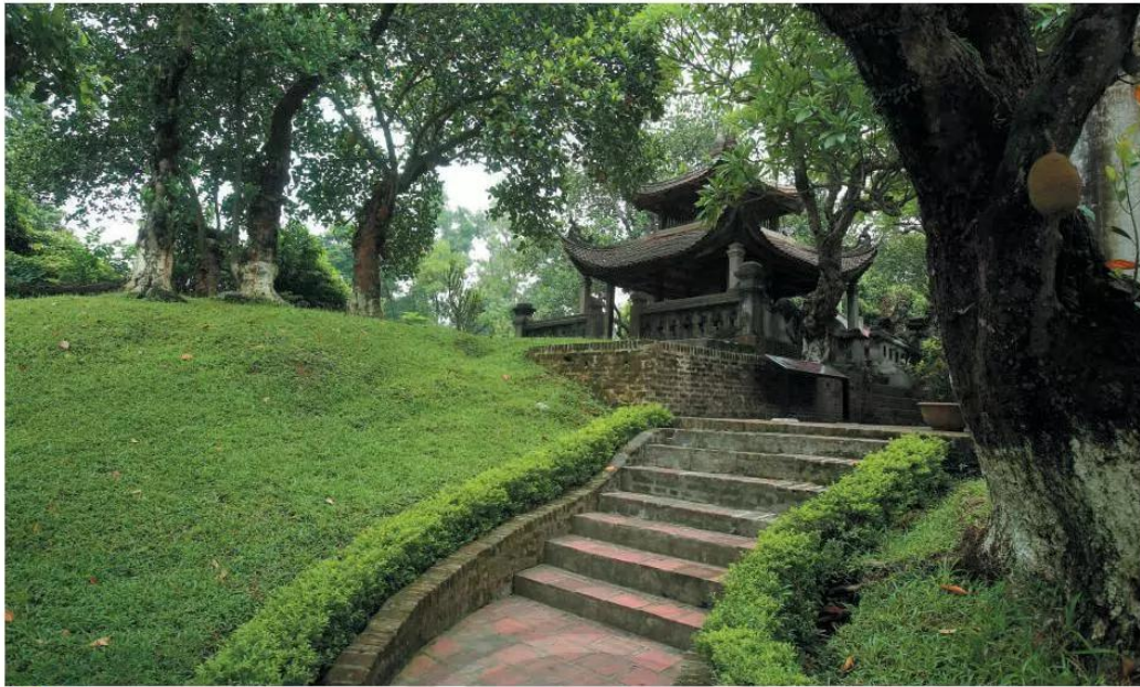
14.3 Dấu vết ụ đất trong thành nội Cổ Loa, nơi vua thiết triều

An Dương Vương cho xây thành Cổ Loa “dài đến ngàn trượng, cao và xoáy tròn ốc” để phòng vệ. Thành Cổ Loa trở thành trung tâm của nước Âu Lạc và là phòng tuyến bảo vệ vững chắc.