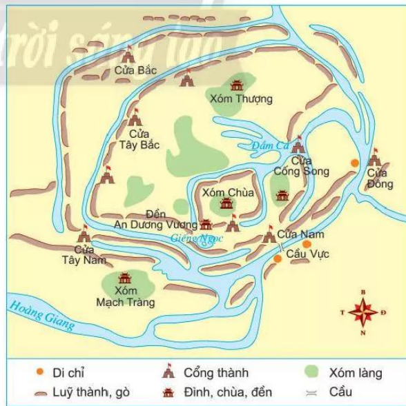
14.4 Sơ đồ khu di tích thành Cổ Loa

Thành Cổ Loa đắp bằng đất, gồm ba vòng khép kín, chu vi khoảng 16 000 m, cao từ 5 m đến 10 m. Mặt ngoài dốc thẳng đứng, mặt trong dốc thoải để đánh vào thì khó, đánh ra thì dễ. Cả ba vòng thành đều có hào nước bao quanh, nối liền với nhau và nối thông với sông Hồng nên lúc nào cũng đảm bảo nước ngập. Thành nội có hình chữ nhật, nay vẫn còn di tích nơi vua thiết triều. Với hệ thống hào – sông, thành và lũy kết hợp chặt chẽ, thành Cổ Loa là một phòng tuyến bảo vệ kiên cố không thể đánh từ ngoài vào.