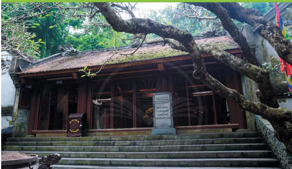
Đền Giếng, khu di tích lịch sử Đền Hùng, Phú Thọ

Khoảng thiên niên kỉ I TCN, những vùng đồng bằng ven biển, ven các dòng sông lớn của nước ta đã là nơi cư trú của các bộ lạc lớn. Họ là chủ nhân của các quốc gia cổ đại đầu tiên trên lãnh thổ Việt Nam như Văn Lang, Âu Lạc, Chăm-pa, Phù Nam. Trải qua những biến động của lịch sử, Phù Nam bị diệt vong, Chăm-pa cường thịnh rồi suy yếu dần. Riêng quốc gia của người Việt đã trải qua hơn ngàn năm Bắc thuộc và giành lại độc lập vào năm 938.